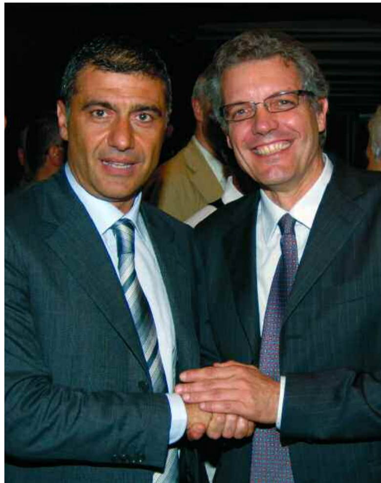
L'Assessore regionale all'Ambiente Nicola de Ruggiero (a destra) con Alfonso Pecoraro Scanio, Ministro dell'Ambiente

Assessore all'Ambiente della Regione Piemonte