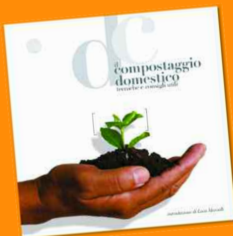
Il manuale “Il compostaggio domestico - tecniche e consigli utili”

2.200 GLI OMAGGI DISTRIBUITI GRATUITAMENTE