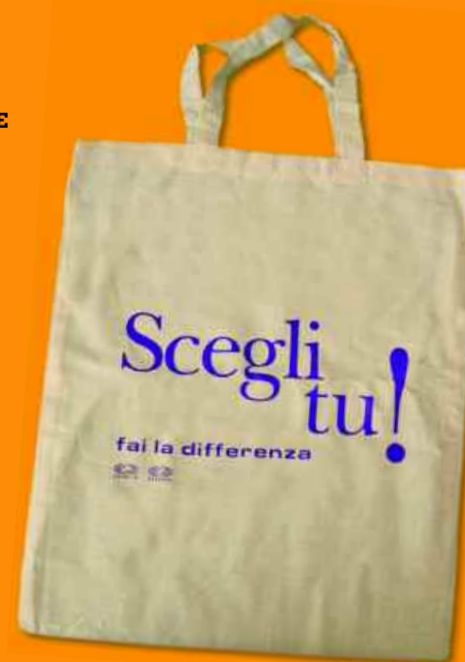
L'ecoborsa in cotone per la spesa